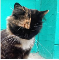
Александр Семенников Речевое кота *) #ОЗАО #Котик http://instagram.com/p/